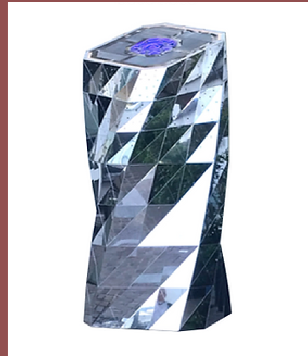
CITY RECHARGING HUB