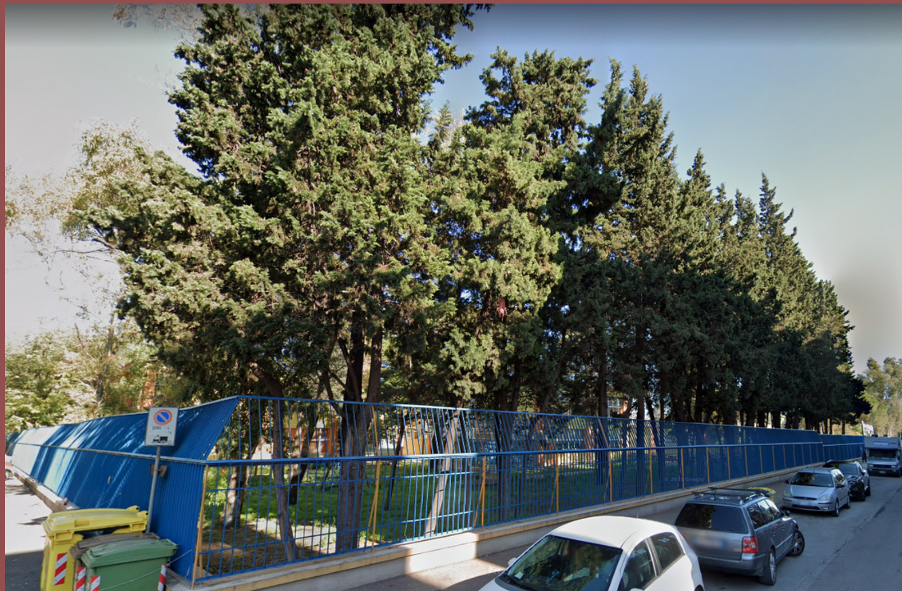
DEPURATORE D'ARIA SMART BIOTECH: VERRÀ POSTO ALL'INTERNO DEL PARCO, A RIDOSSO DEL POLO SIDERURGICO, TRA LE DUE SCUOLE